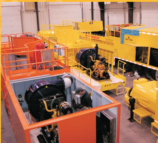
Aire d'assemblage à l'usine Trecan en Nouvelle-Écosse, Canada.

Grâce à leur efficacité frisant les 98 %, les fondoirs de neige Trecan sont les plus efficaces sur le marché du point de vue thermique. Cela est dû à la combustion avec immersion, à la méthode de chauffage à contact direct, et au transfert de l'énergie générée par le processus de combustion à l'eau et à la neige contenues dans la cuve de fonte. Grâce à plus de 35 ans de savoir-faire en ingénierie et en fabrication et d'expérience pratique, les fondoirs de neige Trecan sont les plus éprouvées que l'on trouve actuellement sur le marché.